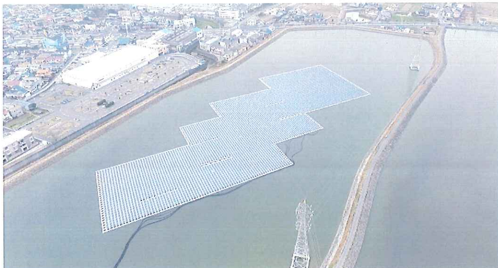
兵庫県稲美町六分一のため池「河原山地」 H27年5月より着工し、平成27年12月月末より稼働